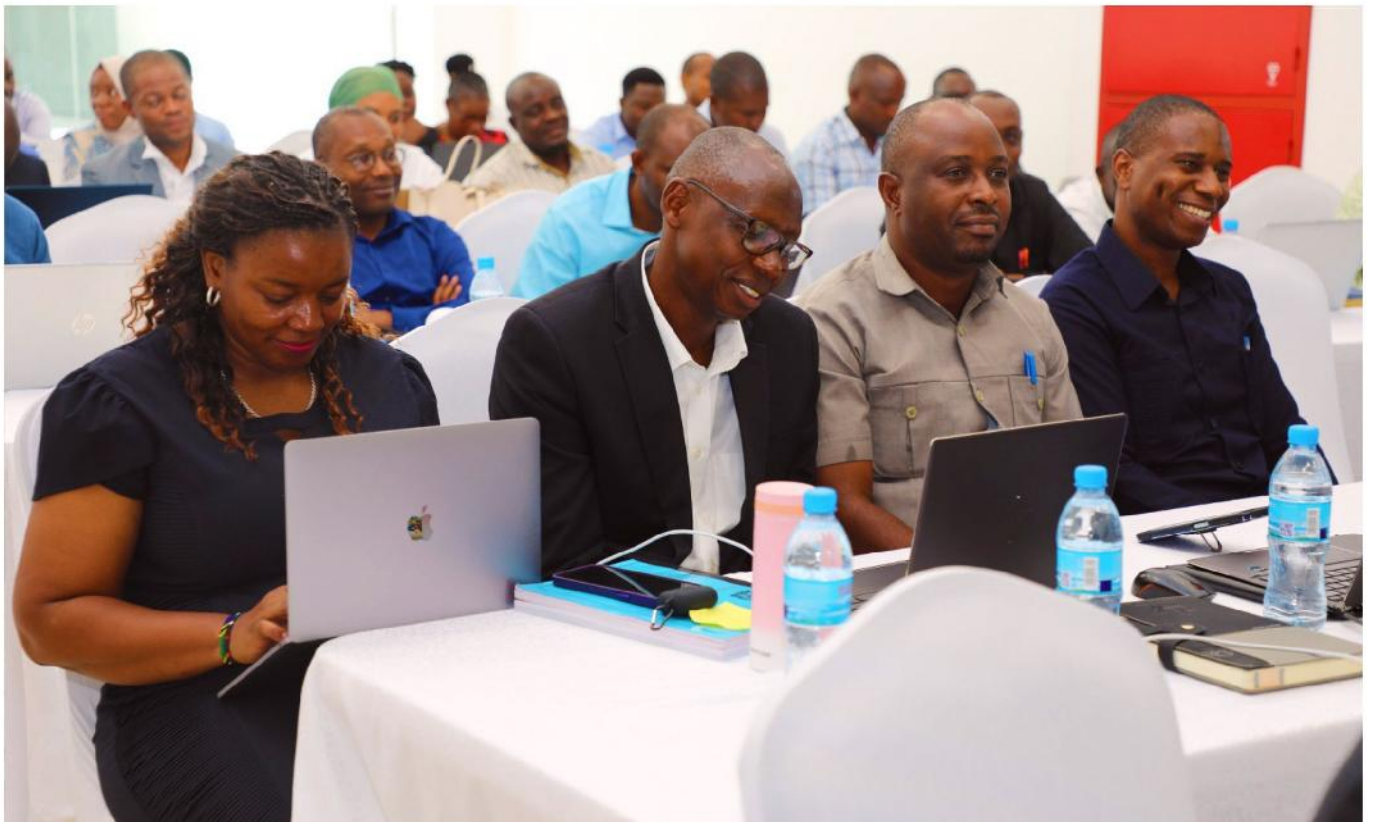
Wajumbe wa Baraza la Wafanyakazi la Mamlaka ya Maabara ya Mkemia Mkuu wa Serikali wakifuatilia taarifa kuhusu utekelezaji wa shughuli mbalimbali za uendelezaji wa Mamlaka kutoka kwa wawasilishaji mbalimbali (hawapo pichani), Kikao cha Tano cha Baraza la Saba la Wafanyakazi wa Mamlaka ya Maabara ya Mkemia Mkuu wa Serikali (GCLA), kilichofanyika katika Ukumbi wa PSSSF Commercial Complex, jijini Dar es Salaam, Februari 15, 2024.