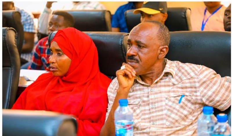
Washiriki wa Mafunzo wakifuatilia mada mbalimbali kwenye mafunzo ya matumizi salama ya kemikali kwa wadau yaliyofanyika Juni 12, 2024.