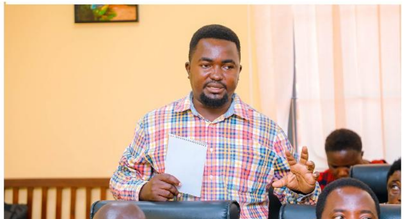
Mshiriki wa mafunzo ya matumizi salama ya kemikali, akichangia mada zilizowasilishwa na wataalam kutoka Mamlaka.