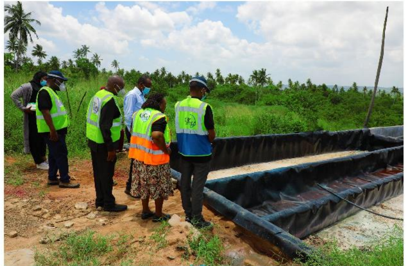
Wajumbe wa Bodi wakikagua eneo la kuteketeza kemikali iliyopo Mkuranga Mkoani Pwani.