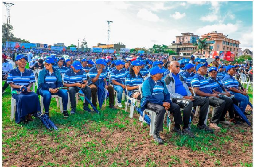
Watumishi wa Mamlaka ya Maabara ya Mkemia Mkuu wa Serikali wakiwa kwenye Sherehe za Siku ya Wafanyakazi Duniani (Mei Mosi).

"Niwashukuru kwa mchango wenu adhimu katika ujenzi wa Taifa letu. Kama yalivyo makundi mengine kwenye jamii, kundi la wafanyakazi lina mchango mkubwa sana katika ujenzi wa nchi yetu. Serikali itaendelea kuimarisha mazingira ya kazi ikiwemo kuboresha maslahi ya wafanyakazi kadri hali ya uchumi itakavyoruhusu," Dkt. Mpango - Makamu wa Rais wa Jamhuri ya Muungano wa Tanzania