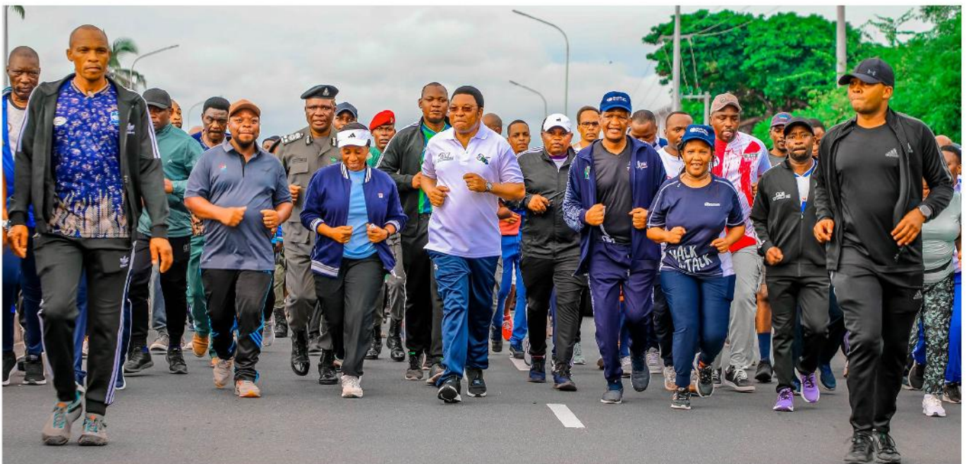
Waziri Mkuu wa Jamhuri ya Muungano wa Tanzania, Mhe. Kassim Majaliwa (katikati), akiiongoza viongozi na wanamichezo katika mazoezi na matembezi ya kilomita 10 yaliyoanzia Coco Beach hadi mzunguko wa Hospitali ya Agha Khan na kurudi Coco Beach kwa lengo la kuhamasisha ufanyaji wa mazoezi ili kujikinga na magonjwa yasiyoambukiza Mei 4, 2024.

Serikali imetangaza rasmi kuwa kuanzia jumamosi ya tarehe 04 Mei, 2024 na jumamosi zote zinazofuata kuwa ni siku ya kufanya mazoezi kwa mikoa yote ya Tanzania ili kupunguza kasi ya ongezeko la magonjwa yasiyoambukiza.