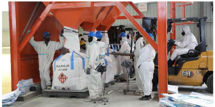
Zoezi la upakiaji wa kemikali aina ya Sulphur kwenye makasha kwa ajili ya uhifadhi.