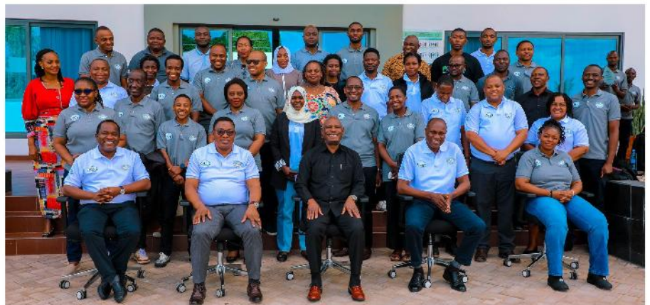
Mkemia Mkuu wa Serikali, Dkt. Fidelice Mafumiko (katikati), akiwa na viongozi pamoja na washiriki wa Mkutano Mkuu wa mwaka wa Wakaguzi wa Kemikali na Maabara za Kemia uliofanyika kwa siku mbili kuanzia Juni 8 hadi 9, 2024, jijini Dodoma.