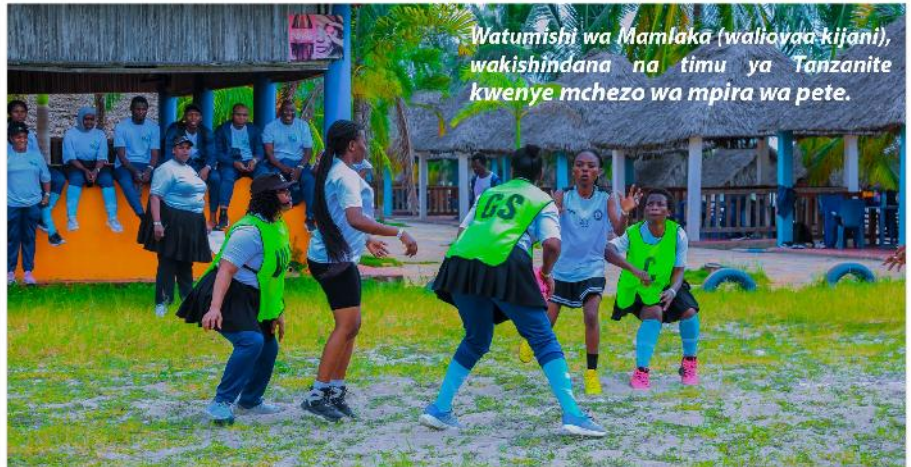
Watumishi wa Mamlaka (waliyoya kijani), wakishindana na timu ya Tanzanite kwenye mchezo wa mpira wa pete.